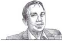
פרופ' עמרי יולין

זה שבועיים שלא מתקיימים שיעורים והסטודנטים, שאמורים לעמוד לצד המורים - נפגעים