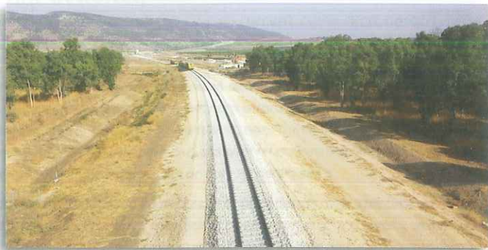
המסילה ליד כפר יהושע