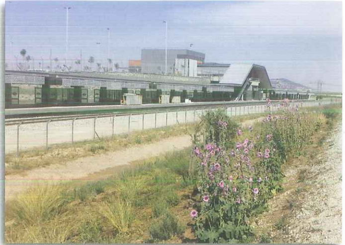
גינון עונתי ליד תחנת כפר ברון

הנושא המייחד את תכנון מסילת העמק נעוץ במורשת ההיסטורית שלה, הקשר בין ישן לחדש. לאור ההכרה בחשיבותה של מסילת העמק ההיסטורית, הנחית התכנון הייתה שלכל האלמנטים הבנויים של המסילה ההסטורית (בניהם: מבני תחנות, גשרים, מעברי מים, ואפילו פסי המסילה), יש חשיבות. לכן, מן הראוי, לשקול את שימורם, שחזורם ושיקומם. בכדי להבהיר את מיקום האלמנטים ההיסטוריים הוכנה, עוד לפני עריכת סקר שימור ראשוני, תכנית, בה סומנו המבנים והאלמנטים החשובים יותר. כמו כן, גובשו המלצות ראשוניות לתכנון, לשימור ולטיפול בתוואי המסילה ובאלמנטים ההיסטוריים. בתכנית התת"ל קיימת הנחייה כי שימור התחנות והמבנים ייעשה במטרה להשמיש את המבנים ולייעדם כחלק ממתחם תיירות. באזור התכנון קיים גשר אחד, גשר הקישון. הגשר עשוי אבן בעל 6 קשתות. יש להמשיך לשמר, לתעדו ולשקמו. לאורך תוואי המסילה קיימים מספר מעברי מים, שתוכננו ובוצעו ברוח המקובלות בתקופה העותומאנית. לכן, עד היום הם בולטים בחזותם הנאה - עם חזיתות אבן טבעית מעובדת, שחורה או בהירה. מעברי המים הם אלמנטים הראויים, בשל התכנון והעיצוב שלהם, לשימור ולשיקום. קטעי מסילה היסטורית שננטשה מופיעים בחלקים נרחבים לאורך התוואי העתידי. תוואי המסילה ההסטורית ממוקם ברובו ע"ג סוללות נמוכות, או על פני הקרקע. חלקים ניכרים מן המסילה פורקו ואינם נראים בשטח. במספר אזורים, כמו בקרבת צומת העמקים ובאזור קריית חרושת, נשמרו והודגשו קטעי מסילה, כחלק ממערך פארקים ושבילי טיול. קטעי המסילה הננטשת באזור קריית חרושת פותחו כחלק מפארק עירוני עם אתרי תיירות, כולל קישור למבני תחנה ומעברי מים המוגדרים כמבנים ואלמנטים לשימור ולשיקום.