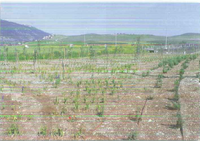
שיקום נופי לאורך התוואי בהפרדה 722 באזור כפר יהושע