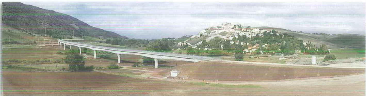
גשר באזור קרית טבעון.

התוואי המתוכנן באורך כ-60 ק"מ מתחיל בחיפה בגשר פז, ועובר דרך מרכזית לב המפרץ, בקומה מעל רכבת נהריה-ת"א. משם עובר התוואי