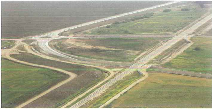
המסילה באזור כפר ברוד