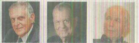
מימין: פרופ' אברהם הרשקו, פרופ' אהרון צ'חנובר ופרופ' דן שכטמן

פרופ' דן שכטמן, יליד תל אביב, מהפקולטה למדע והנדסה של הומרים בטכניון, חוקר את מבנה החומר שגילה והביא להגדרתו של מבנה גבישי חדש של גבישים כמו-מחזוריים (קוואזי-מחזוריים). על גילוי זה זכה שכטמן בפרס נובל בכימיה לשנת 2011.